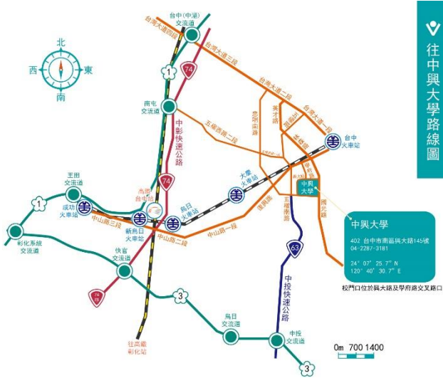
➤ 圖書館校園指引圖